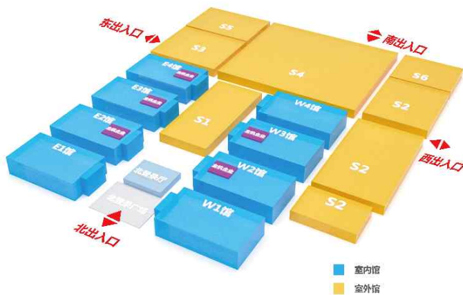
展览规划说明 Exhibition planning