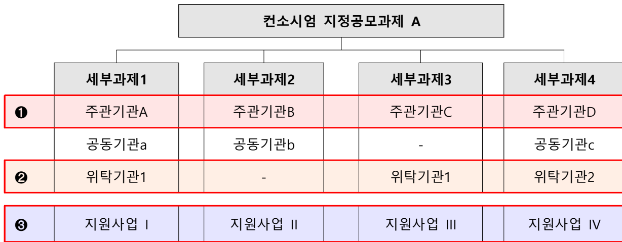
< 예시 : 컨소시엄형 기술개발 연구개발기관 구성(안) >