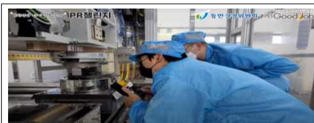
(유튜버 촬영) 유튜버 기업 탐방 영상 예시