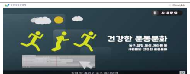
(일반 촬영) 기업 홍보 영상 예시