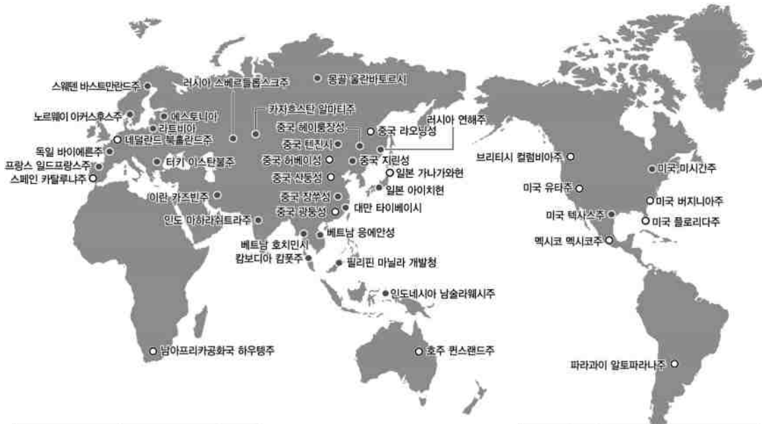
○ 자매결연 체결(10개국 15개지역)